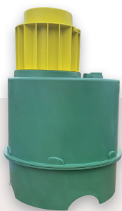
Бокс с приманкой

Бокс оснащен датчиком движения для подсчета крыс, полакомившихся приманкой. Через 14 дней при помощи мобильного считывателя определяют количество зверьков.